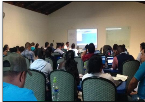
Evento de Capacitación 22 Municipalidades, en la Ciudad de Valle de Ángeles, Francisco Morazán.